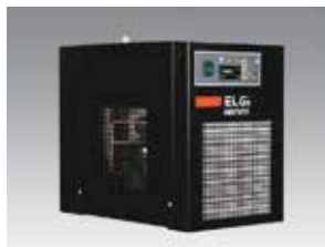
Sécheur d'air frigorifique