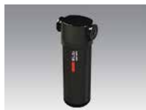
Séparateur cyclonique d'humidité