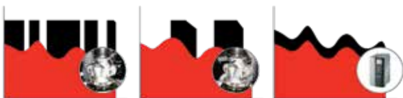
Système de chargement/ déchargement Système de modulation à l'aspiration Économie d'énergie avec Système VFD

Dotée d'un système de mise à vide intégrée, commandée par électrovanne et actionneurs, la vanne d'admission de nouvelle génération contribue à limiter les pertes. La soupape d'admission contrôle de manière optimale la capacité du compresseur lors du démarrage, réduisant ainsi la charge de démarrage sur le moteur.