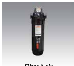
Filtre à air